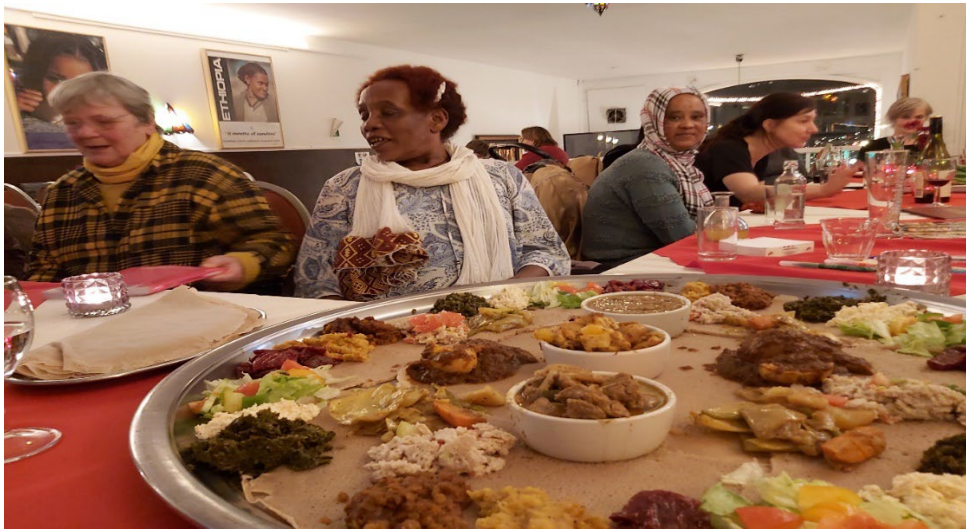
Afscheid van restaurant Taytu

Op 11 februari 2023 aten we met 20 vluchteling-vrouwen en 10 VTU buddy's in het restaurant van Negede. Het eten was heerlijk, vooral in het licht van de komende 6 weken vastenmaand! En het was goed om weer eens als groep met elkaar te praten over de stressvolle asiel- en opvang-situaties van de vrouwen, over hun angst voor beëindiging van hun LVV-deelname en -opvang, en voor teruggestuurd worden naar hun landen van herkomst. In die zin was dit niet zomaar een etentje, maar vooral een voorbereiding op de 'Terugkeer is een fictie – ongedocumenteerd op straat geen oplossing' avond van VTU in Pakhuis De Zwijger op 20 april.